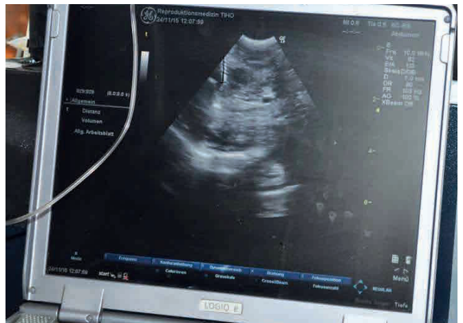
Eizellentnahme: Transvaginale Punktion unter Ultraschallkontrolle